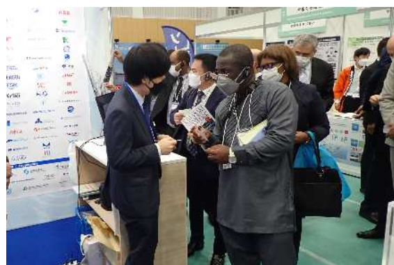
海外からの来場者のブース訪問