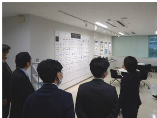
かわBizネットコーナーの見学