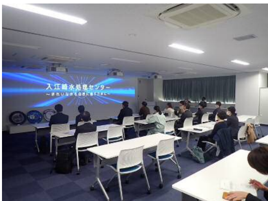
入江崎水処理センターの概要説明