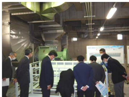
入江崎水処理センターの見学