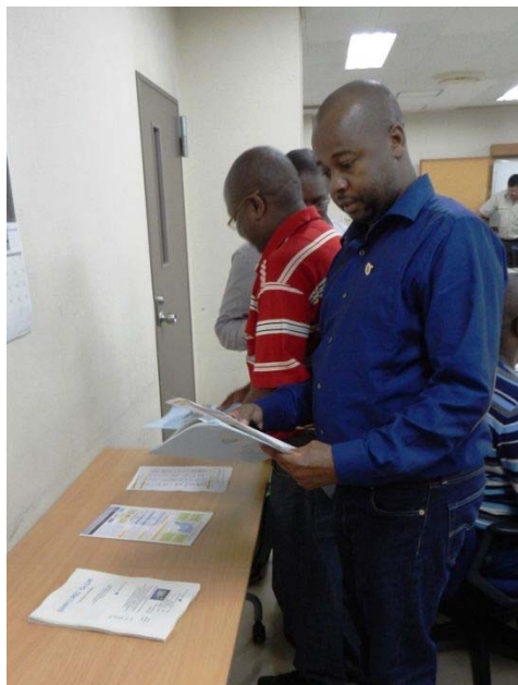
かわBizネットの紹介と 希望会員の資料配布