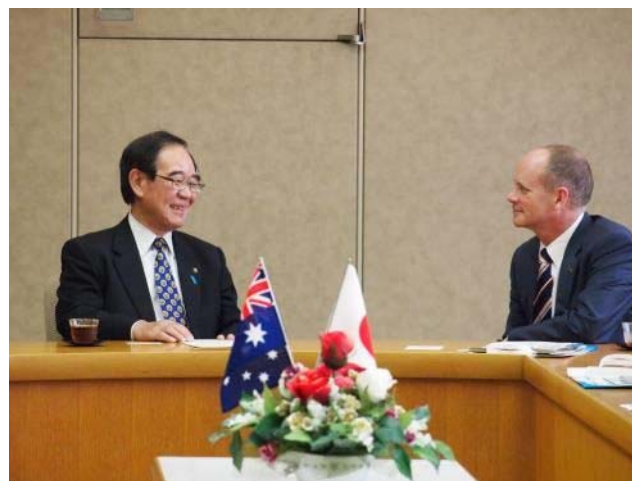
川崎市の成長戦略について 意見交換