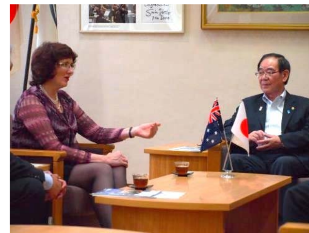
左:フィオナ・シンプソン議長 右:阿部市長