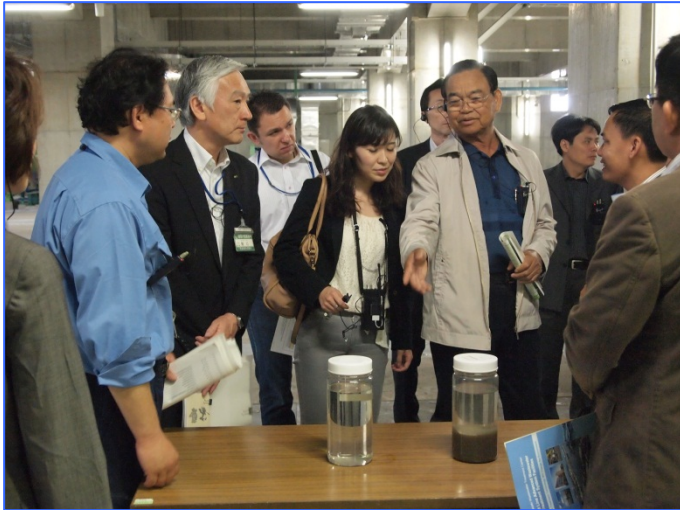
高度処理水を見ながら質問する モック・マレット カンボジア上級大臣兼環境大臣

2013年5月19日、東アジア低炭素成長パートナーシップ対話へ参加するため日本を訪れたカンボジアのモック・マレット上級大臣兼環境大臣ほか、カンボジア、ベトナム、オーストラリア、ロシアから計4か国7名の方々が、日本の優れた環境技術を視察するため川崎市を訪問しました。入江崎水処理センターでは下水高度処理施設などを視察し、日本の水処理技術に強い関心を示しました。