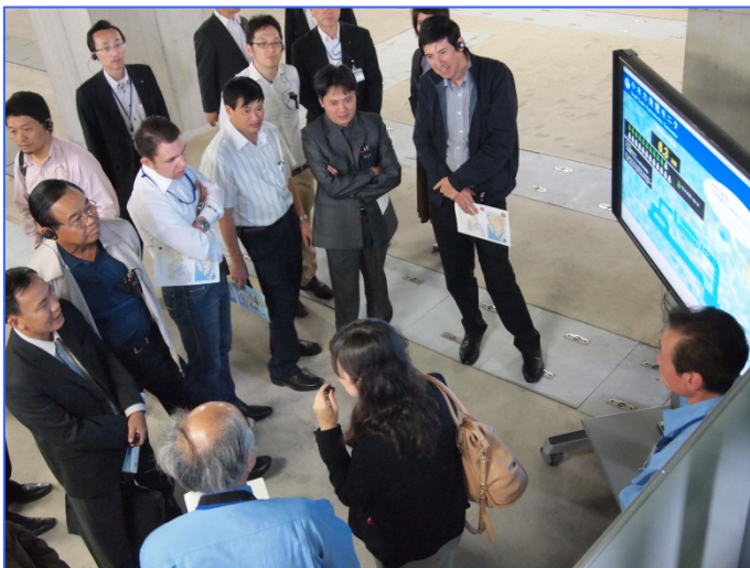
放流水の落差を利用した 小水力発電を視察